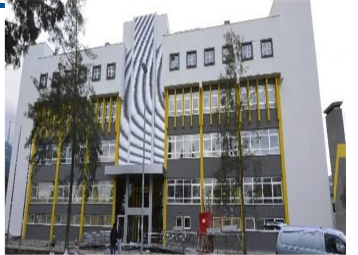
DEPARK (Dokuz Eylül Teknoloji Geliştirme) Sağlık Teknoparkı