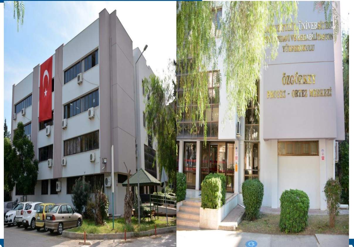
Fizik Tedavi ve Rehabilitasyon Yüksekokulu