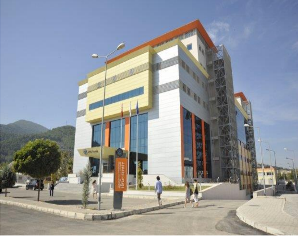
İzmir Uluslararası Biyotıp ve Genom Enstitüsü